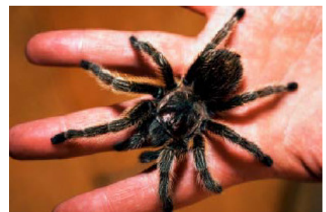
Angstbesetzte Inhalte als Stressoren

Anweisungen, Bilder, Sprachausgabe oder Videos sind als Stressoren einsetzbar.